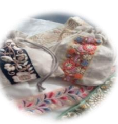
刺繍リボンポーチ