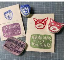
粘土細工(例:はんこ作り)