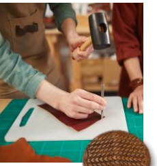
レザークラフト(皮工芸)