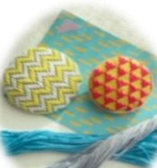
こぎん刺しブローチ